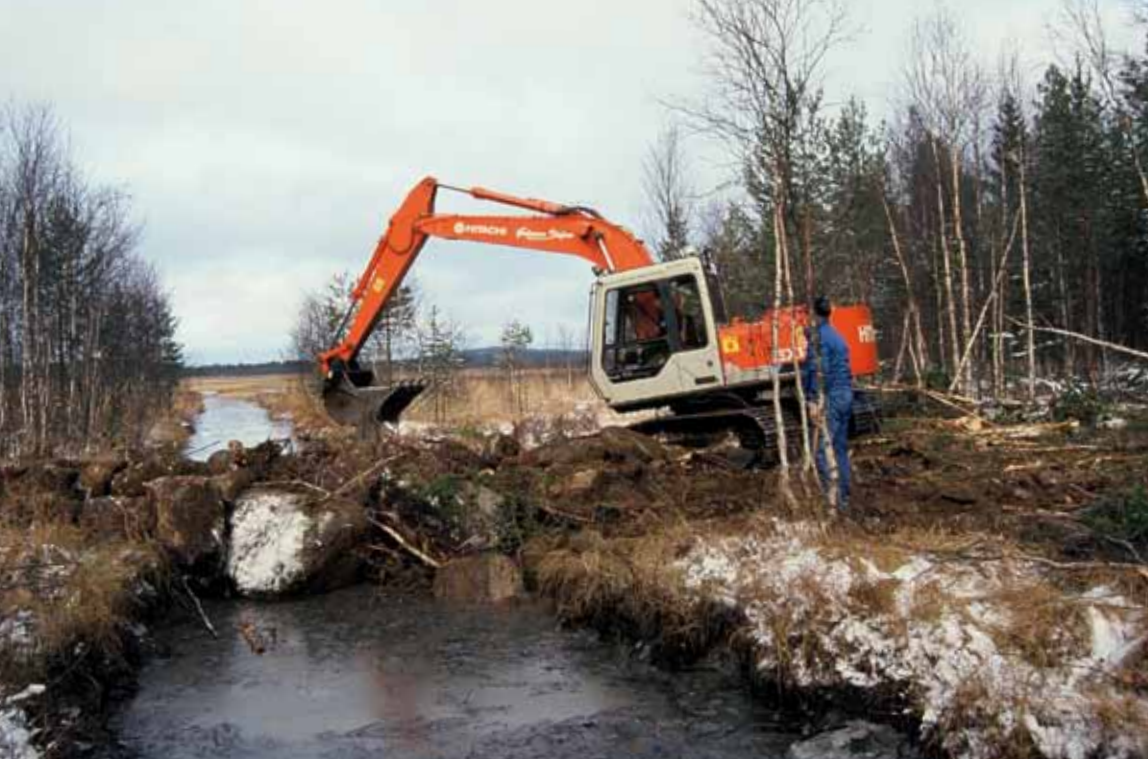
FOTO MOLLÄNGTRÄSK ÅTERSOPAS (OVAN) OCH BRÄDDAVLOPP STAVTRÄSKET (NEDAN): CARL VON ESSEN