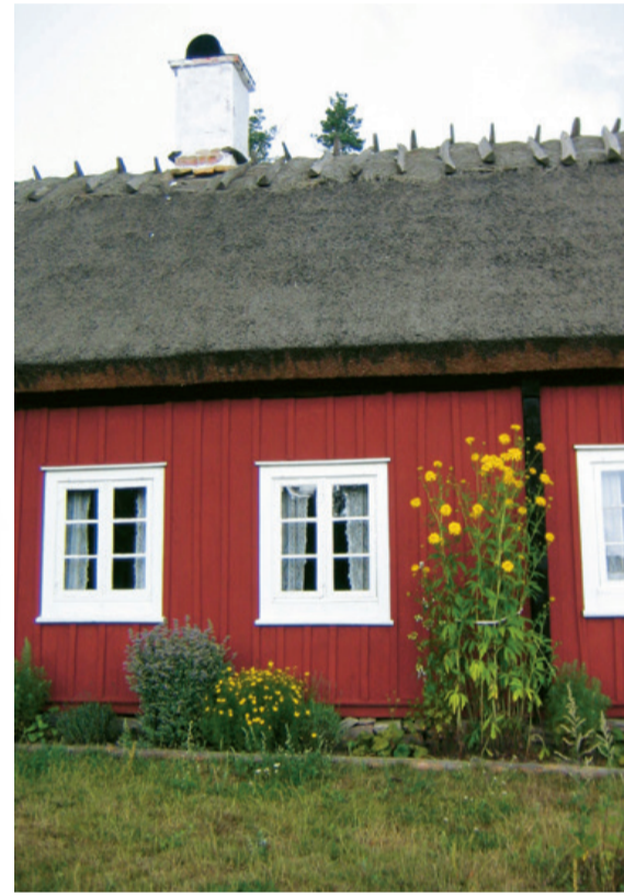
Kulturväxter i sin rätta miljö.