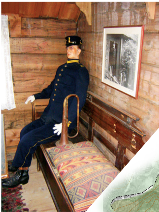
Rodatorpet var ett soldatorp.