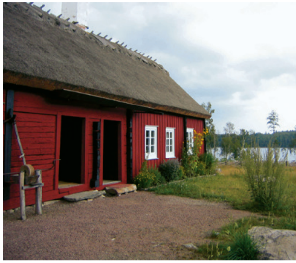
Rodatorpet med sjön Farlängen i bakgrunden.