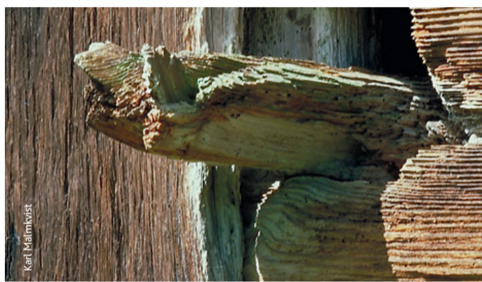
Gården är uppförd i knuttimring och skiftesverk

Sporrakulla gård består av två boningshus från olika tidsepoker, en trelängad ekonomibyggnad och en gräsbevuxen gårdsplan. De äldre byggnaderna är uppförda i skiftesverk och knuttimring och har omålade väggar. Taken täcks med karakteristiska taksticker som troligen ersatt äldre halm- och torvtak. På loftet i den västra loftboden syns de tränaglar som höll tidigare takspån på plats. Sporrakulla gårdens nuvarande äldsta byggnad uppfördes kring sekel skiftet 1600-1700. Den bestod då av en ryggåsstuga med tvåvånings loftbodar vid gavarna, en s.k. högloftsstuga. I början av 1800-talet höjdes ryggåsstugans tak i nivå med den västra loftboden. Den östra loftboden, som bl.a. innehöll undantagsstuga för de äldre, revs i mitten av 1800-talet. Undantagsstugans eldstad finns kvar på ryggåsstugans östra gavel.