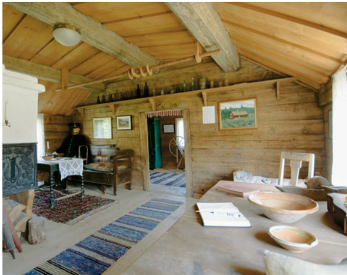
Interiör från Rodatorpet.